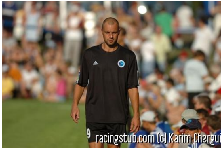
Le capitaine est de retour

☆☆☆☆ (0 note) 📅 27/11/2005 05:00 🏏 Avant-match 🌐 Lu 1.269 fois 👤 Par marco 🗨️ 0 comm.