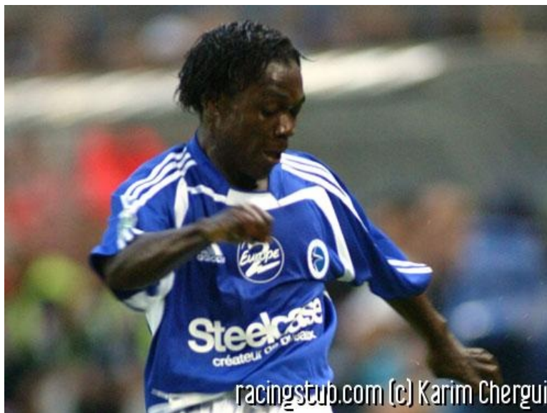
Après une saison d'adaptation, on attend beaucoup de Boka

☆☆☆☆ (0 note) 📅 05/06/2005 05:01 📍 Au jour le jour 🕒 Lu 1.450 fois 👤 Par jo 🗨️ 0 comm.