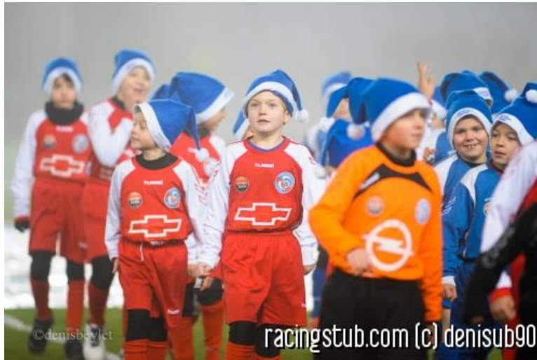
Verdammi, c'est pas les bonnes couleurs

☆☆☆☆ (0 note) 📅 26/12/2013 05:00 👤 Personnel 👁 Lu 5.103 fois 👤 Par mediasoc 💬 3 comm.