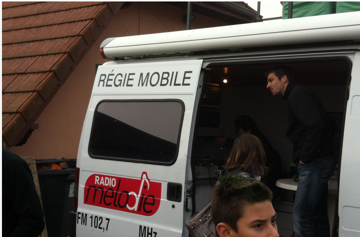
Le fameux "car régie"