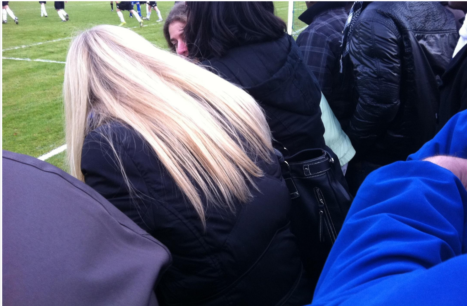
Aperçu de la visibilité

Le racing aggrave le score, les Strasbourgeois applaudissent sans tomber dans l'excès. Alors que chacun s'apprête à profiter de la mi-temps pour aller chercher, qui une bière, qui un vin chaud (pénurie), qui les toilettes, l'USS réduit le score sous les vivats des 2 000 spectateurs. De quoi entretenir un mince espoir. La mi-temps permet aux animateurs de Radio Mélodie, installés dans un car régie de fortune, d'égayer l'ambiance en offrant des stylos. Quant au commentateur, il suit le match assis sur une cabine téléphonique désaffectée présente (pourquoi?!) en bord de terrain.