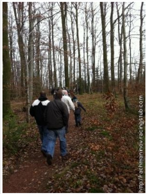
Le sentier d'accès au stade

Les supporters du Racing poursuivent leur exploration de l'Alsace du Nord et de ses alentours avec cette virée au pays de Bitche. Un timide soleil inonde de lumière la région et confère à l'expédition un certain charme. Ça, c'est ce qu'on se dit à l'aller, dans la voiture. Puis on entre dans Montbronn et on s'aperçoit qu'il s'agit du village le plus étendu du monde. Une rue principale interminable à remonter et on arrive enfin au stade. Pour éviter de marcher sur la route, il suffit d'emprunter le sentier d'un parcours santé, parfaite balade digestive.