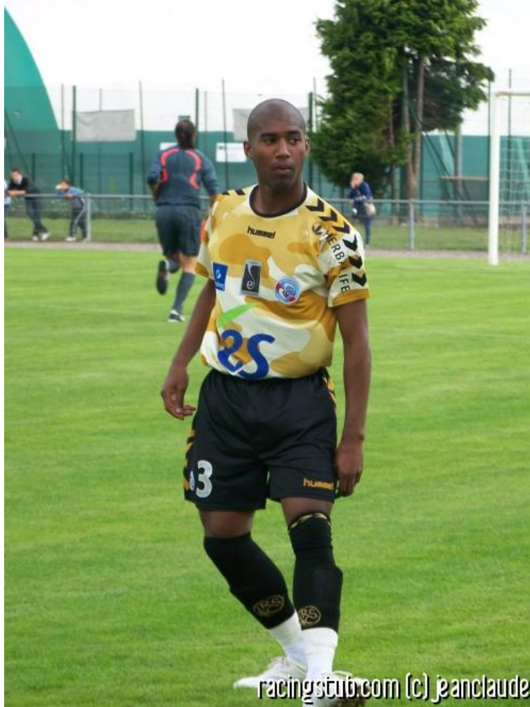
"JAF", encore à la peine ce soir

☆☆☆☆ (0 note) 📅 18/08/2009 22:22 📍 Après-match 🌐 Lu 1.830 fois 👤 Par zottel 🗨️ 0 comm.