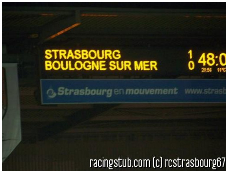
Le match aller

☆☆☆☆☆ (0 note) 📅 16/05/2009 05:01 📍 Avant-match 🌐 Lu 1.514 fois 👤 Par guigues 🗨️ 0 comm.