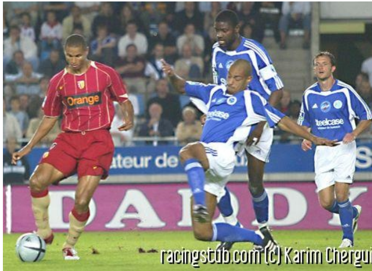
Au nouveau capitaine d'emmener le Racing à la victoire

☆☆☆☆ (0 note) 📅 16/10/2004 05:01 📍 Avant-match 🌐 Lu 871 fois 👤 Par superdou 💬 0 comm.