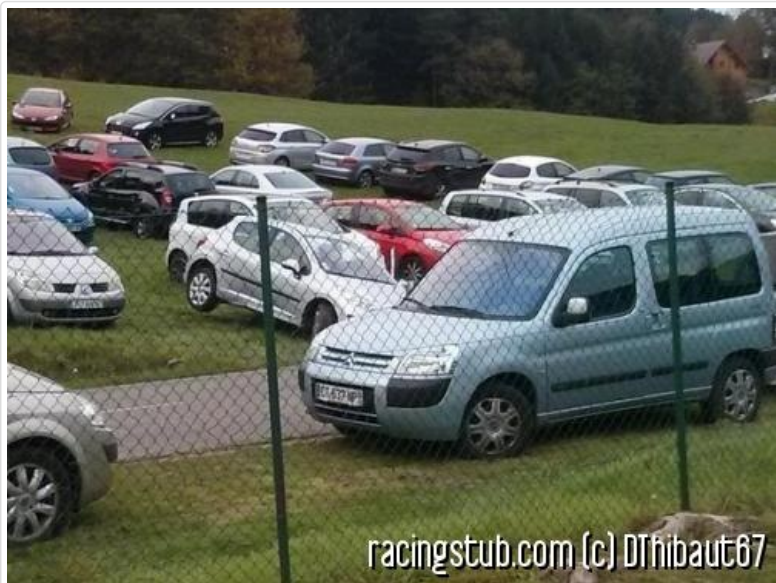
Phénomène étrange : la voiture qui lévite