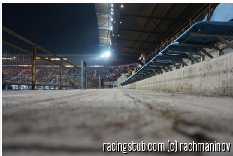
Ambiance champêtre minérale à la Meinau