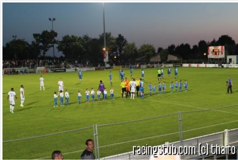
Ambiance champêtre en Vendée

11 octobre : Guebwiller Italiens - Racing