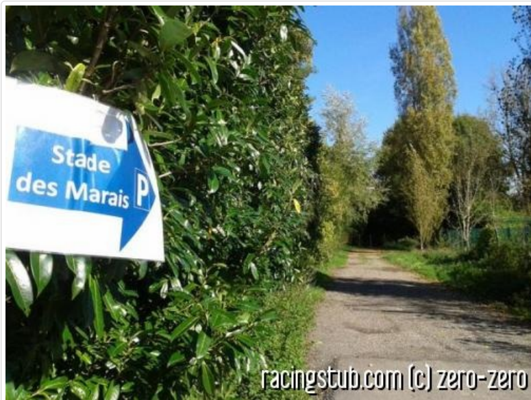
Ambiance champêtre à Chambly