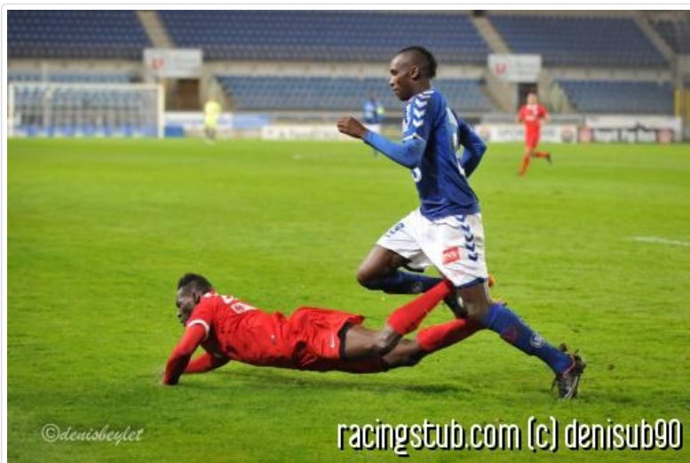
Expression du jour : courir ventre à terre