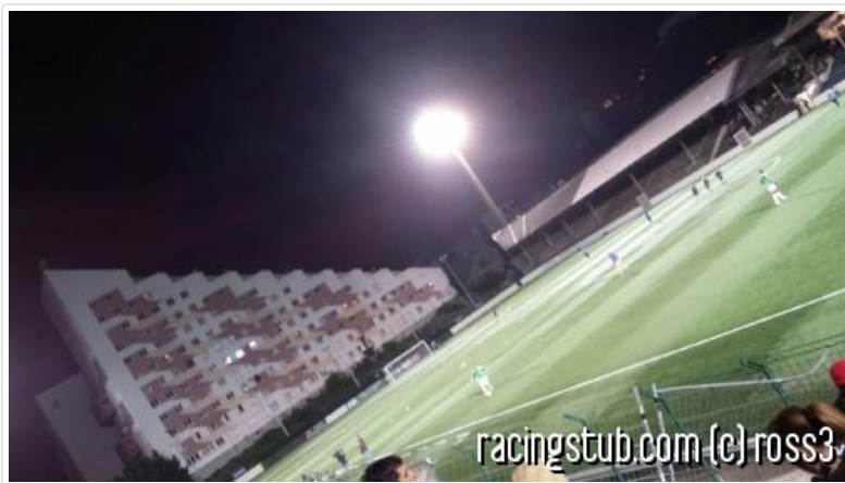
Expérimentation de la FFF : le terrain en pente réussit aux Strasbourgeois