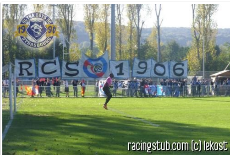
Sans doute le premier tifo de l'histoire du stade de Chambly