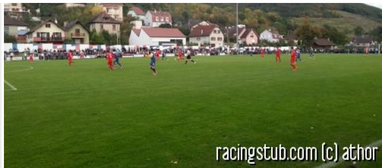
Ambiance champêtre à Guebwiller